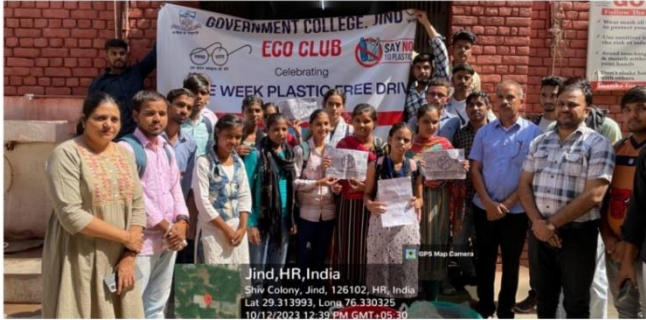
Jind, HR, India Shiv Colony, Jind, 126102, HR, India Lat 29.313993, Long 76.330325 10/12/2023 12:39 PM GMT+05:30