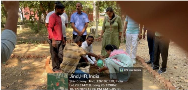
Jind HR, India Shiv Colony, Jind, 126102, HR, India Lat 29.314218, Long 76.329862 10/12/2023 12:06 PM GMT+05:30