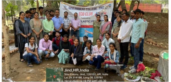
Jind, HR, India Shiv Colony, Jind, 126102, HR, India Lat 29.314188, Long 76.329781 10/12/2023 12:19 PM GMT+05:30