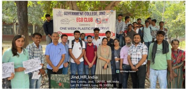
Jind, HR, India Shiv Colony, Jind, 126102, HR, India Lat 29.314463, Long 76.330052 10/12/2023 12:43 PM GMT+05:30