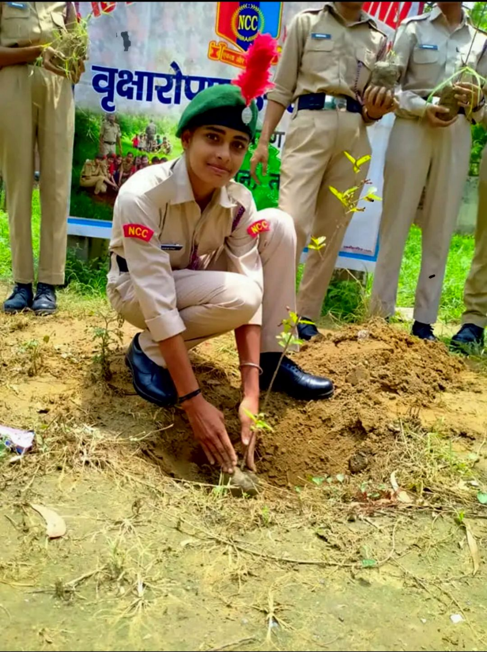
Govt College jind