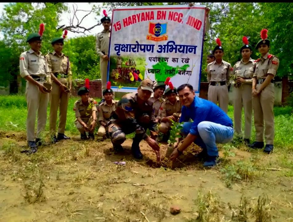
Govt College jind