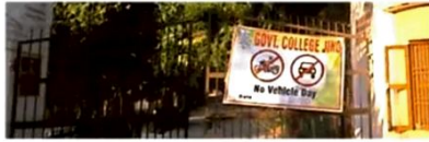
राजकीय पीजी कालेज के गेट पर लगाया गया बैनर। • जगतपाल।

नो व्हीकल-डे के लिए कुछ इस तरह किया प्रेरित