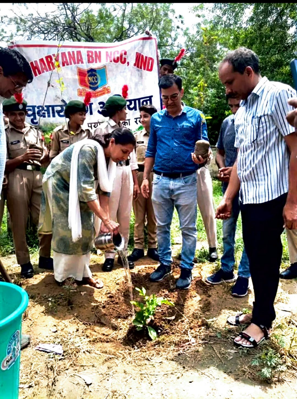
Govt College jind