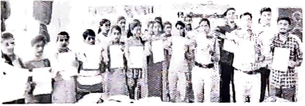
विचार गोष्ठी में संकल्प लेते विद्यार्थी व अन्य।